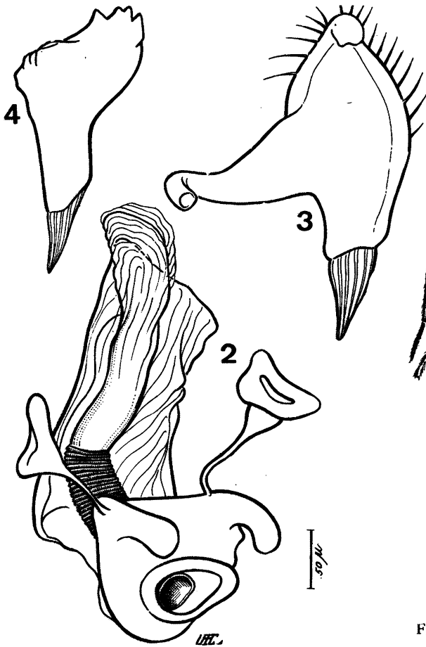
Fig. 2 - Linharesmiris viridis n. sp.: Fig. - 2 - penis; Fig. 3 - parâmetro esquerdo; Fig. 4 - parâmetro direito.